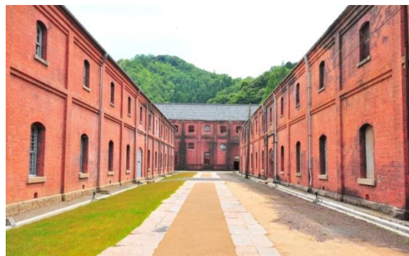
<舞鶴赤レンガ倉庫群>

舞鶴も高齢者率が高く（30.5%・全国平均26.6%）、認知症や独居老人の訪問、また精神疾患の訪問依頼も増えてきています。