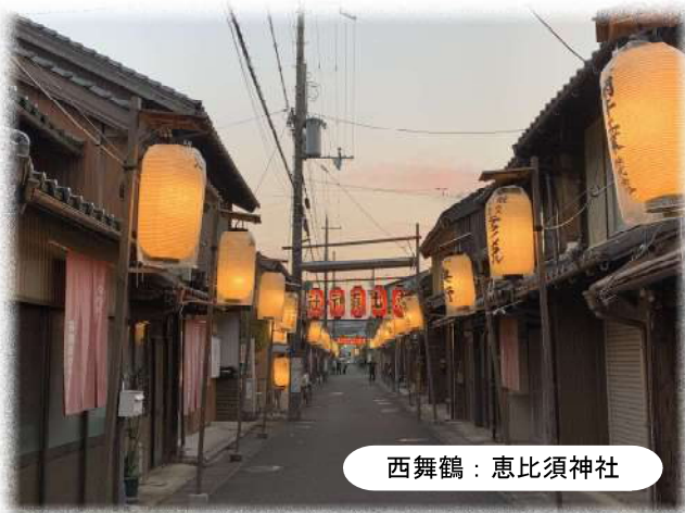
西舞鶴：恵比須神社

した。そもそもこういったことができるのは、日本が平和であったからこそです。しかし、世界に目を配るとロシアとウクライナ、そしてイスラエル、パレスチナの戦闘・惨劇をまのあたりにし、心を痛めるばかりです。「われらは、全世界の国民が、ひとしく恐怖と欠乏から免かれ、平和のうちに生存する権利を有する」と日本国