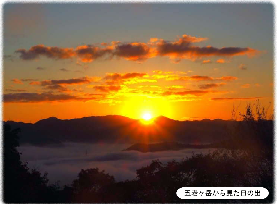
五老ヶ岳から見た日の出

私達は双方の暴力的行為を非難し「人道的休戦」そして「停戦」を訴えていかねばならないと思います。