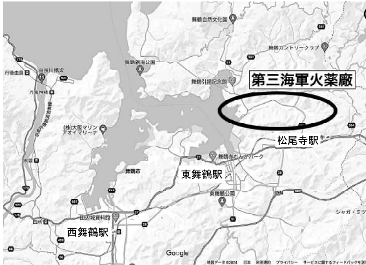
第三海軍火薬廠位置図

本の近代化を支えた産業・交通・土木に関わる建造物」であり、日本の「輝かしい」近代を象徴するものと言えるでしょう。