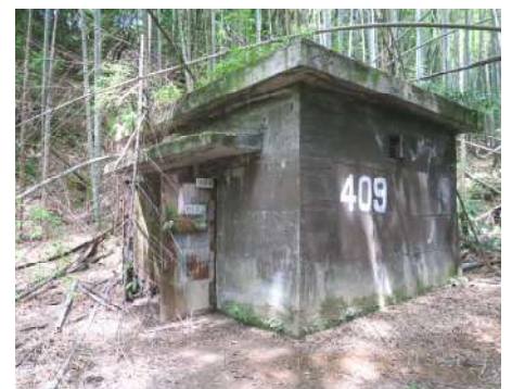
成型製品一時置場跡