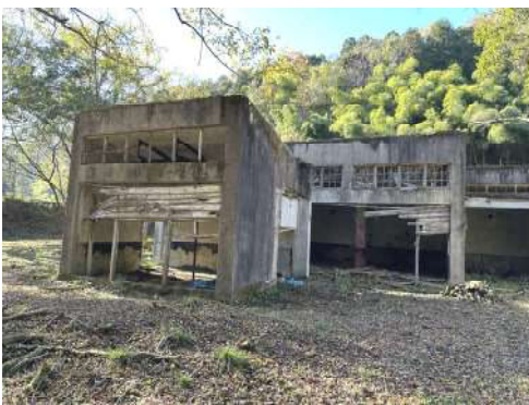
砲炸薬成型工場跡